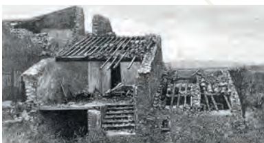
Fig. 3. — Après une maison de La Redorte (bâtie après le cyclone de 15 août 1845). (D'après une photographie de W. G. Drouot.)