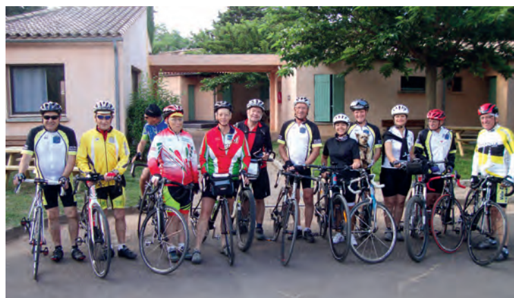
"Départ des cyclos pour la balade autour du lac du Salagou"

En dehors des activités, le vélo club est toujours mobilisé pour faire avancer le dossier de Voie Verte sur le tracé de l'ancienne voie ferrée Moux-Caunes. Cette voie serait un atout touristique supplémentaire de notre beau territoire et une avancée dans les pratiques des déplacements doux des habitants surtout dans le secteur de Caunes-Peyriac-Rieux avec la proximité du collège et de la piscine communautaire. Il faudra une volonté politique forte pour que ce dossier arrive à éclore. Sait-on jamais !