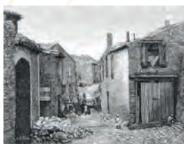
Fig. 2. — Vue rue de La Redorte après le cyclone.

Le cyclone de la Redorte est l'un des plus meurtriers parmi l'ensemble des cas recensés à ce jour en France.